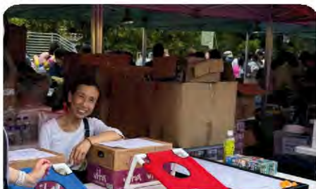
義工協助明愛賣物會