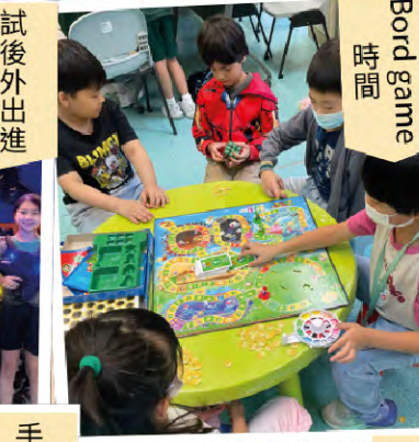
Bord game 時間