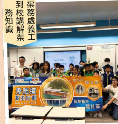
渠務處義工 到校講解渠 務知識