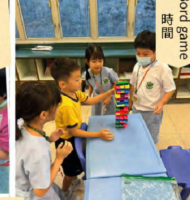
Bord game 時間