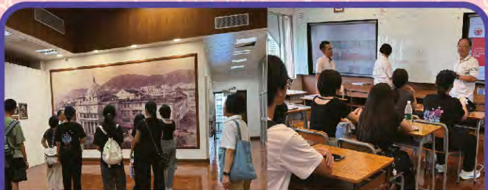
新來港青少年參觀喇沙書院，老師給予同學大大的鼓勵