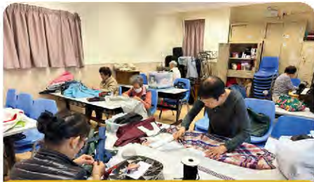
再生遮布製作過程