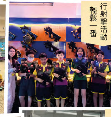
試後外出進 行射擊活動 輕鬆一番