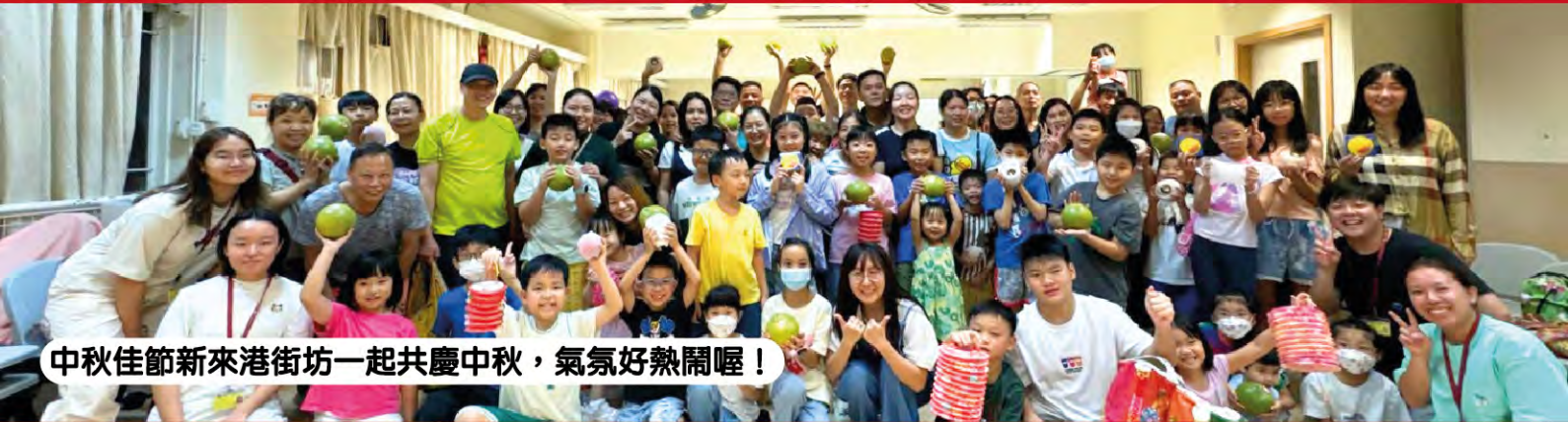
中秋佳節新來港街坊一起共慶中秋，氣氛好熱鬧喔！