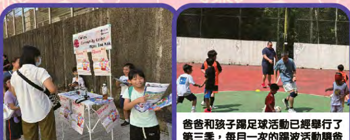
融入社區親子一起來做義工

爸爸和孩子踢足球活動已經舉行了第三季，每月一次的踢波活動讓爸爸和孩子也十分期待。